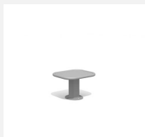
SWC.4964 Jump Platform 300