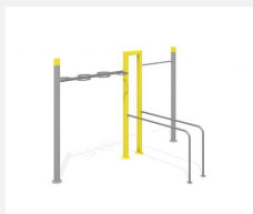
SWC.4654 Streetworkout 654