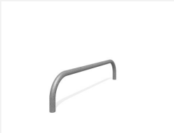
SWC.4957 Push up 957