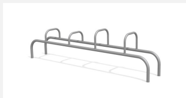
SWC.4951 Workout 951