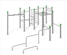
SWC.4961 Streetworkout 961