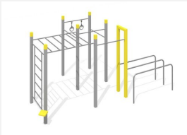
SWC.4956 Bootcamp 956