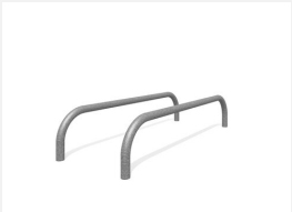
SWC.4958 Push Up 958