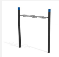
SWC.4651 Wave Bar 651