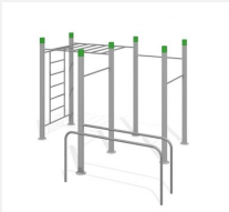
SWC.4588 Streetworkout 588