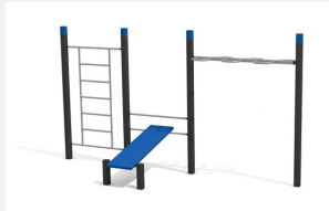
SWC.4652 Streetworkout 652