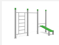
SWC.4573 Streetworkout 573