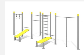
SWC.4574 Streetworkout 574