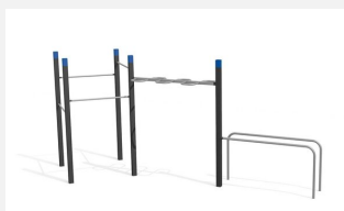
SWC.4653 Streetworkout 653