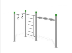
SWC.4568 Streetworkout 568