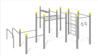
SWC.4567 Streetworkout 567