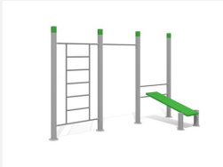
SWC.4573 Streetworkout 573