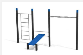
SWC.4652 Streetworkout 652