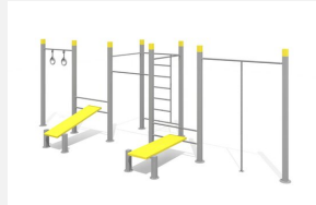
SWC.4574 Streetworkout 574