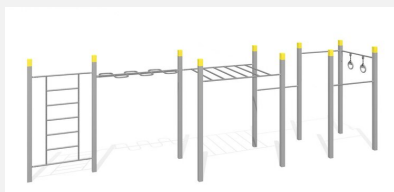
SWC.4585 Streetworkout 585