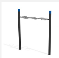
SWC.4651 Wave Bar 651