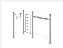
SWC.4568 Streetworkout 568