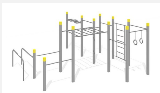
SWC.4567 Streetworkout 567