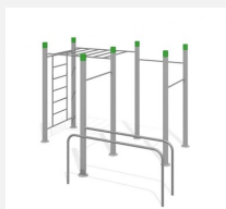
SWC.4588 Streetworkout 588