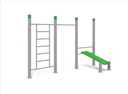
SWC.4573 Streetworkout 573