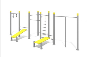
SWC.4574 Streetworkout 574