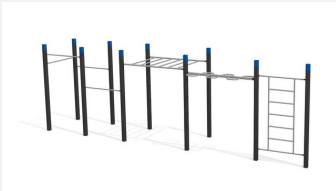
SWC.4559 Streetworkout 559