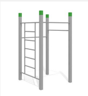
SWC.4552 Streetworkout 552 - Modèle