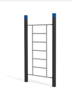
SWC.4551 Wall 551