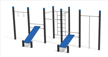
SWC.4558 Streetworkout 558