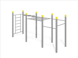
SWC.4560 Streetworkout 560