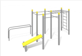
SWC.4564 Streetworkout 564