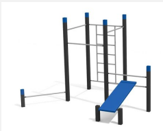
SWC.4556 Streetworkout 556