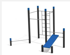
SWC.4556 Streetworkout 556