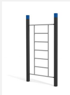
SWC.4551 Wall 551