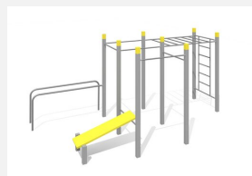
SWC.4564 Streetworkout 564