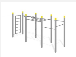
SWC.4560 Streetworkout 560