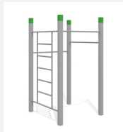
SWC.4552 Streetworkout 552 - Modèle