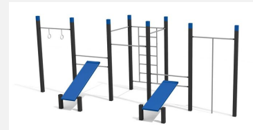
SWC.4558 Streetworkout 558