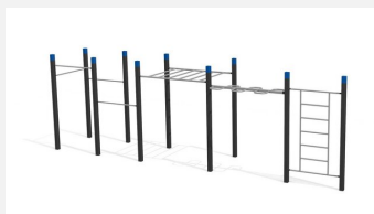
SWC.4559 Streetworkout 559