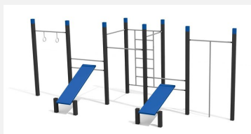
SWC.4558 Streetworkout 558