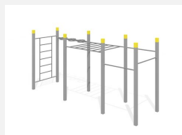
SWC.4560 Streetworkout 560