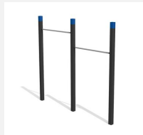
SWC.4452 Pull Up bars 452