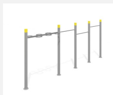
SWC.4462 Streetworkout 462