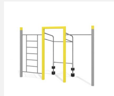
SWC.4459 Streetworkout 459