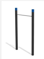
SWC.4451 Pull Up bars 451