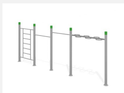
SWC.4461 Streetworkout 461