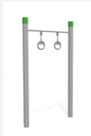
SWC.4465 Anneaux 465