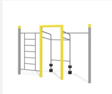
SWC.4459 Streetworkout 459