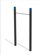
SWC.4451 Pull Up bars 451