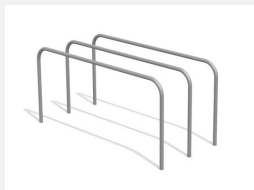
SWC.4355 Parallel Bars 355