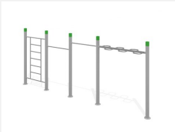
SWC.4461 Streetworkout 461