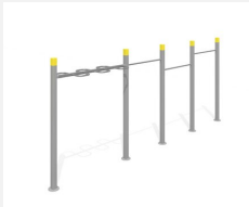
SWC.4462 Streetworkout 462