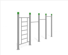
SWC.4463 Streetworkout 463