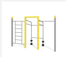
SWC.4459 Streetworkout 459