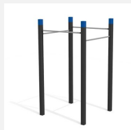
SWC.4455 Pull Up bars 455