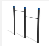
SWC.4452 Pull Up bars 452