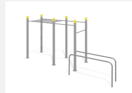
SWC.4260 Streetworkout 260