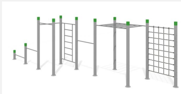
SWC.4258 Streetworkout 258