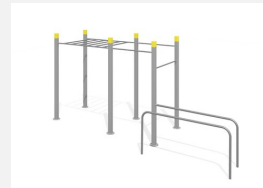
SWC.4260 Streetworkout 260