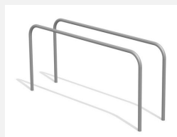
SWC.4354 Barres parallèles 354