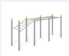
SWC.4262 Streetworkout 262