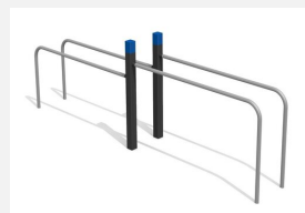
SWC.4353 Parallel Bars 353