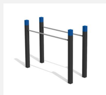
SWC.4351 Barres parallèles 351