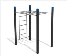
SWC.4254 Streetworkout 254