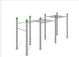
SWC.4256 Streetworkout 256