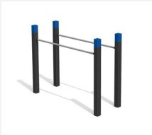
SWC.4351 Barres parallèles 351