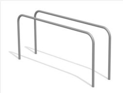
SWC.4354 Barres parallèles 354