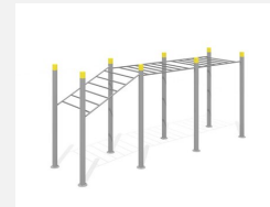
SWC.4262 Streetworkout 262