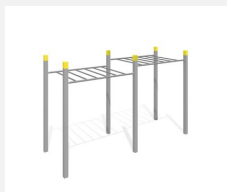
SWC.4252 Echelle de singe 252