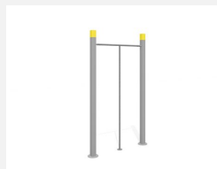
SWC.4009 Dance Pole 009