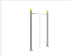
SWC.4009 Dance Pole 009