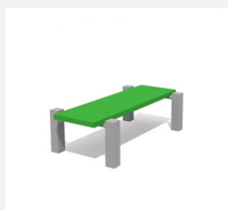
SWC.4112 Bench 112