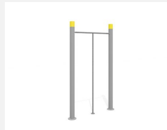
SWC.4009 Dance Pole 009