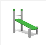
SOPR.007 Banc incliné 113