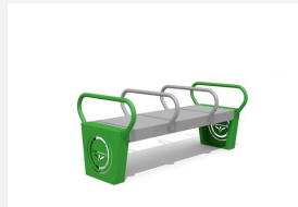
SWC.4101 Dip bench 3