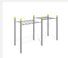
SWC.4252 Echelle de singe 252