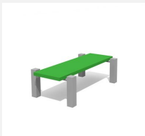
SWC.4112 Bench 112