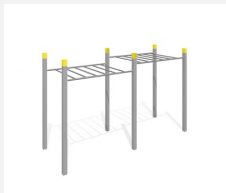
SOPR.006 Echelle de singe 252 - Bonne affaire