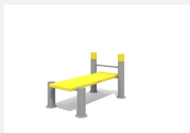
SWC.4119 Planche Abdo 119