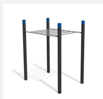
SWC.4251 Monkey bars 251