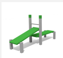
SWC.4115 Double bench 115