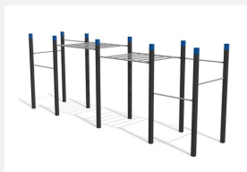
SWC.4253 Streetworkout 253