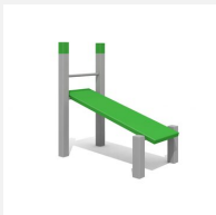
SOPR.007 Banc incliné 113