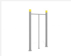
SWC.4009 Dance Pole 009