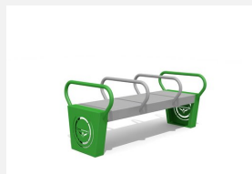
SWC.4101 Dip bench 3