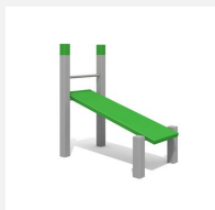
SOPR.007 Banc incliné 113