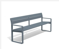
BT.161.BA.C Banc Quo duro avec accoudoirs, color