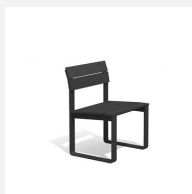
BT.161.S Stuhl Quo duro