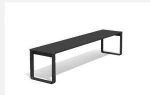
BT.161.H Hockerbank Quo duro