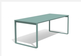
BT.161.T.C Table Quo duro color