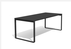
BT.161.T Table Quo duro