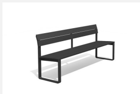
BT.161.B Banc Quo duro