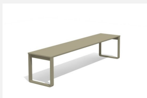
BT.161.H.C Hockerbank Quo duro color