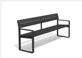
BT.161.BA Banc Quo duro avec accoudoirs