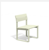
BT.161.S.C Stuhl Quo duro color