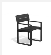
BT.161.SA Chaise Quo duro avec accoudoirs