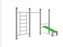
SWC.4573 Streetworkout 573