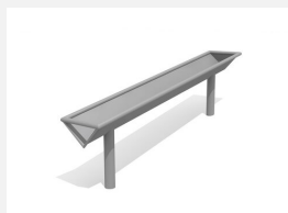
SW.141.51 Rigole en biais 150