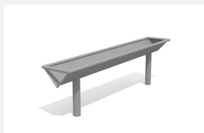
SW.141.50 Rigole droite 150