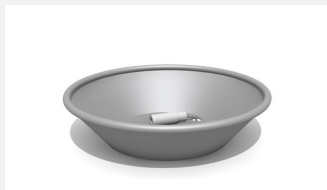
SW.141.20 Bassin rond en forme de cône, sans support