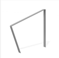
DI.108.19.I Appui vélos Areo 95.1 inox