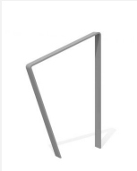
DI.108.16.I Appui vélos Areo 65.1 inox