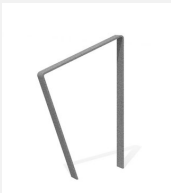
DI.108.16 Appui vélos Areo 65.1