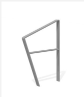
DI.108.26.I Appui vélos Areo 65.2 inox