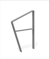
DI.108.26 Appui vélos Areo 65.2