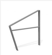
DI.108.29 Appui vélos Areo 95.2