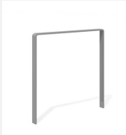
DI.107.18.I Appui vélos Quo 85.1 inox