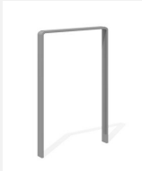
DI.107.15.I Appui vélos Quo 55.1 inox