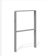
DI.107.25.I Appui vélos Quo 55.2 inox