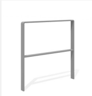
DI.107.28.I Appui vélos Quo 85.2 inox