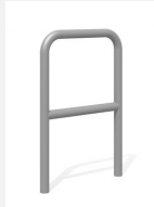
DI.106.25.I Appui vélos Tube 55.2