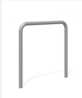
DI.106.18.I Appui vélos Tube 85.1 inox