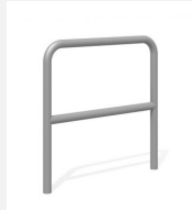
DI.106.28.I Appui vélos Tube 85.2 inox