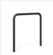
DI.106.18.C Appui vélos Tube 85.1 color