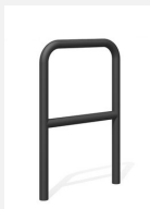
DI.106.25.C Appui vélos Tube 55.2