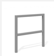
DI.105.28.I Appuis vélos Pura 85.2 inox