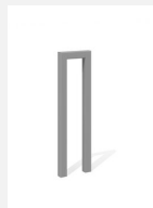
DI.105.12.I Appuis vélos Pura 25.1