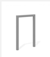
DI.105.15.I Appuis vélos Pura 55.1 inox