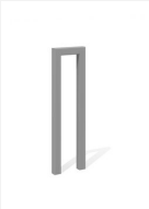
DI.105.12.I Appuis vélos Pura 25.1