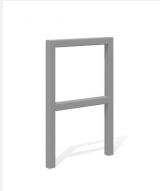
DI.105.25.I Appuis vélos Pura 55.2 inox