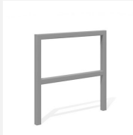
DI.105.28.I Appuis vélos Pura 85.2 inox