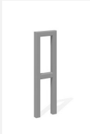
DI.105.22.I Appuis vélos Pura 25.2