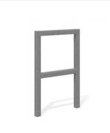
DI.105.25 Appuis vélos Pura 55.2