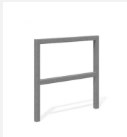
DI.105.28 Appuis vélos Pura 85.2