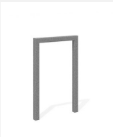
DI.105.15 Appuis vélos Pura 55.1

Numéro de l'article DI.105.12 Nom de l'article Appuis vélos Pura 25.1 Dimension de l'engin H 85 x L 25 x B 5 cm Nombre de monteurs 1 Temps de montage 1 h complet