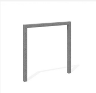
DI.105.18 Appui vélos Pura 85.1