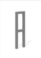
DI.105.22 Appuis vélos Pura 25.2