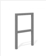
DI.105.25 Appuis vélos Pura 55.2