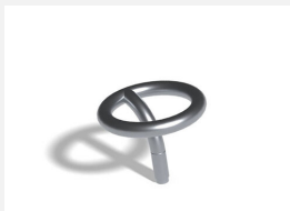
C300 L'anneau 2 incliné