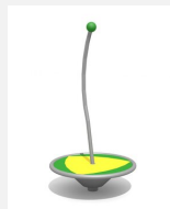
C364 Le ver tournant