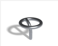
C874 L'anneau 1 droit