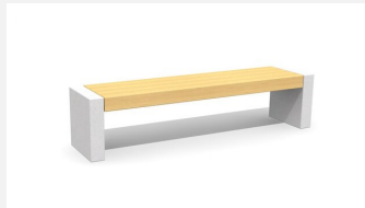
BT.151.H.22 Banc sans dossier Versi béton 220