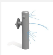
SW.135.1 Jet d'eau 1 avec poignée rotative