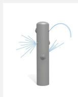
SW.135.3 Jet d'eau 3 avec buse à