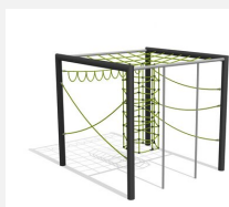
KL.160.1.25 Cube de grimpe en métal 1, hauteur 250