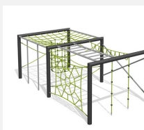
KL.160.2.20 Cube de grimpe en métal 2, hauteur 200