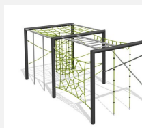
KL.160.2.25 Cube de grimpe en métal 2, hauteur 250 cm