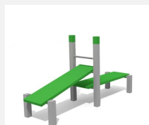
SWC.4115 Double bench 115