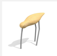
BN.310.4 La cigogne