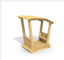
XL.3.01.02 Remorque avec toit