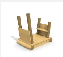
XL.3.01.03.L Remorque sans toit - lasuré